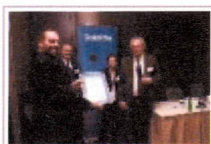
Certyfikat członkowski dla firmy Baltic Industries and Services